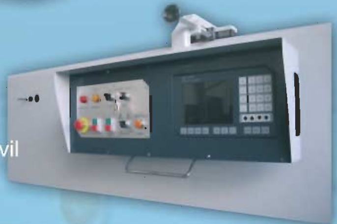
Botonera de mandos móvil Movable controls