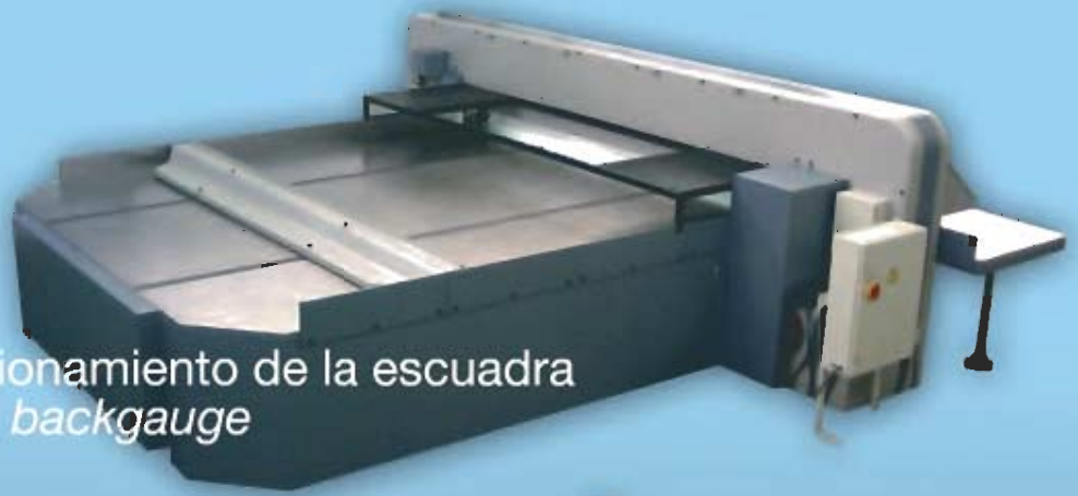
Alta velocidad de posicionamiento de la escuadra High speed positioning backgauge