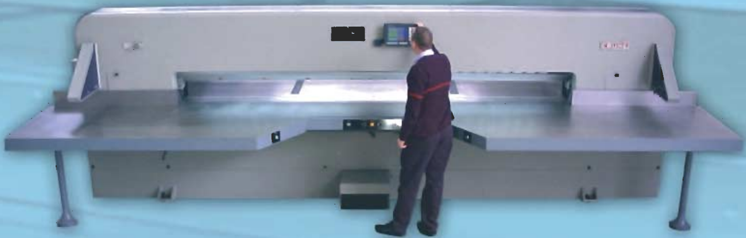
Escuadras laterales abatibles para cargar y descargar Retractable side gauges for loading and unloading